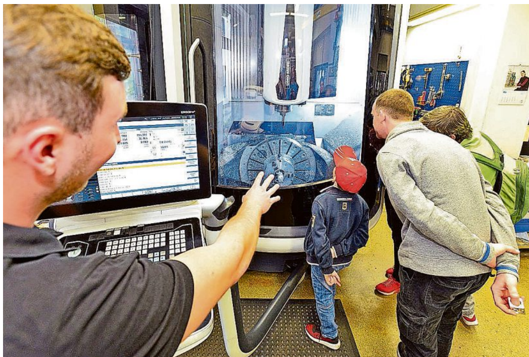
Bei der „Lange Nacht der Wirtschaft“ am 30. Juni haben kleine und große Besucher von 17 bis 23 Uhr wieder die Möglichkeit, bei 14 Unternehmen in der Region einen Blick hinter die Kulissen zu werfen.

Was treibt ein Flugzeug an? Wie werden Kunststoffe hergestellt, die im Automobilbau und der Luftfahrt eingesetzt werden? Und wozu dient ein Exoskelett? Antworten auf diese und viele weitere Fragen erhalten die großen und kleinen Besucher vor Ort im Gespräch mit den Mitarbeitern der Unternehmen. Besonders auch für