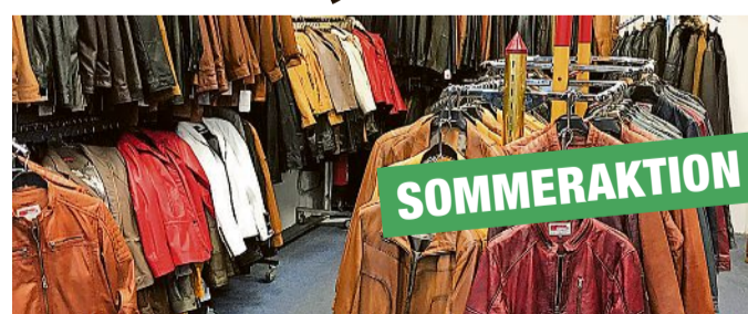
Lederjacken in reicher Auswahl und hervorragender Qualität.