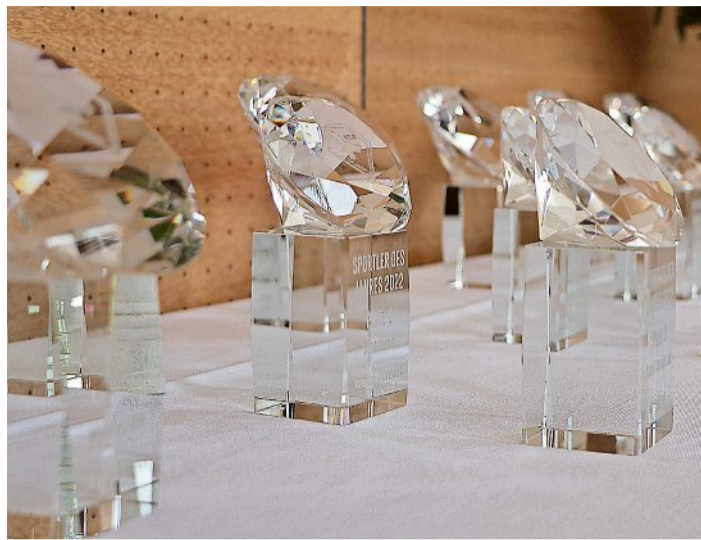
Erstmals wurden in diesem Jahr die "Sportdiamanten" geehrt und damit das neue Logo der Sportlerehrung des Landkreises in entsprechender Diamantenform präsentiert.

Populärste Sportler, Mannschaften und Funktionäre in Wildau ausgezeichnet